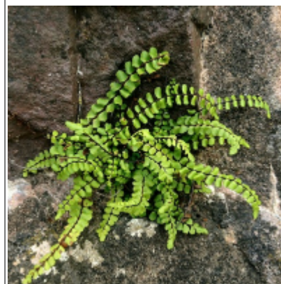
Abb. 4: Foto mit einer Bildgröße von 400 x 400 px in Originalgröße (Eigenes Foto)