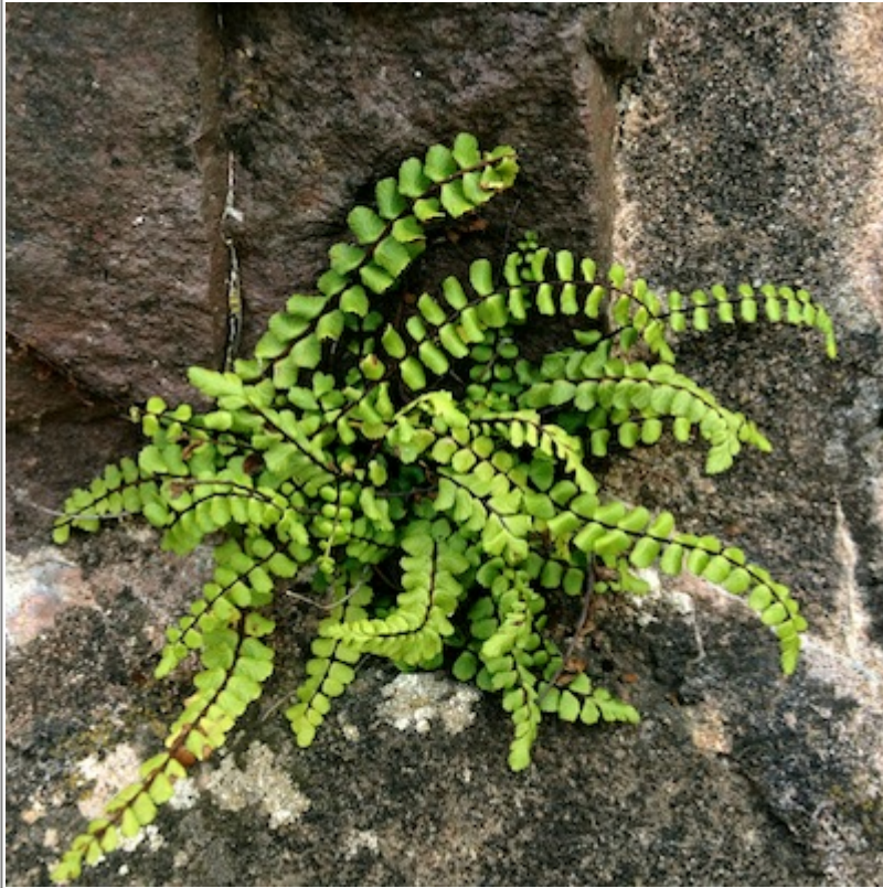
Abb. 4: Foto mit einer Bildgröße von 400 x 400 px in Originalgröße