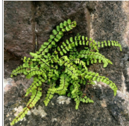
Abb. 5: Foto mit einer Bildgröße von 400 x 400 px auf eine dargestellte Größe von 200 x 200 px reduziert. Es sind keine Qualitätsverluste zu sehen.