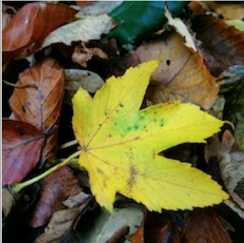
Abb. 3: Foto mit einer Bildgröße von 200 px auf eine dargestellte Größe von 400 x 400 px »aufgebläht«. Die Farbinformation der zusätzlich dargestellten Pixel muss basierend auf deren Nachbarpixeln »geraten« werden. Dadurch leidet die Darstellungsqualität, das Foto wird »pixelig«.