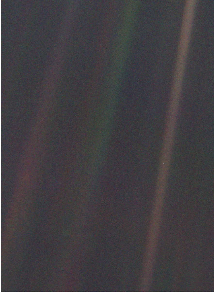
Foto der Erde, das von der Raumsonde Voyager 1 aus ca. 6,4 Milliarden Kilometern Entfernung aufgenommen wurde. Die Erde ist der winzige helle Punkt in der Mitte der orangenen Linie rechts. Sie nimmt auf dem Bild ca. 12 % eines Bildpunkts (Pixel) ein. Die Linien sind Reflexionen von Sonnenlicht auf der Optik der Kamera.