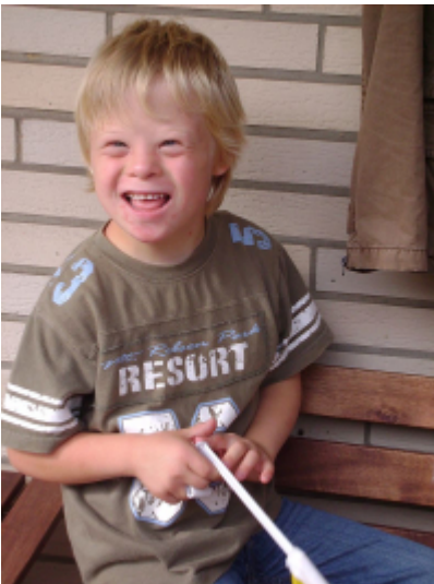
Achtjähriger Junge mit Trisomie 21

Die Chromosomen des Menschen kann man sich, wie hier abgebildet, vorstellen. Hier ist das 21. Chromosom dreifach vorhanden.